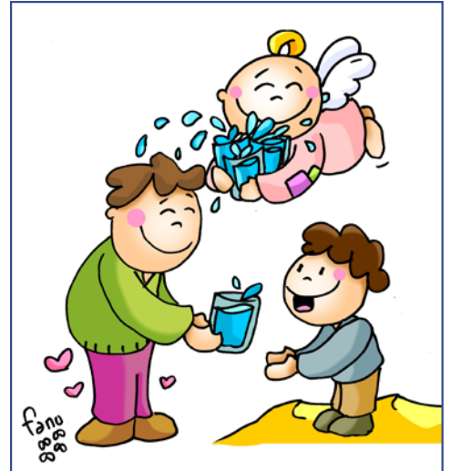
Un vaso de agua dado a los pequeños te saciará desde el cielo