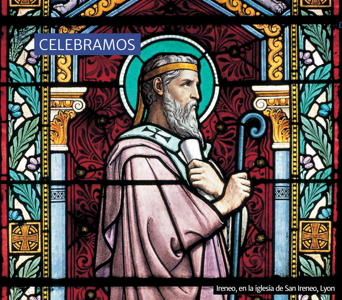
Ireneo, en la iglesia de San Ireneo, Lyon