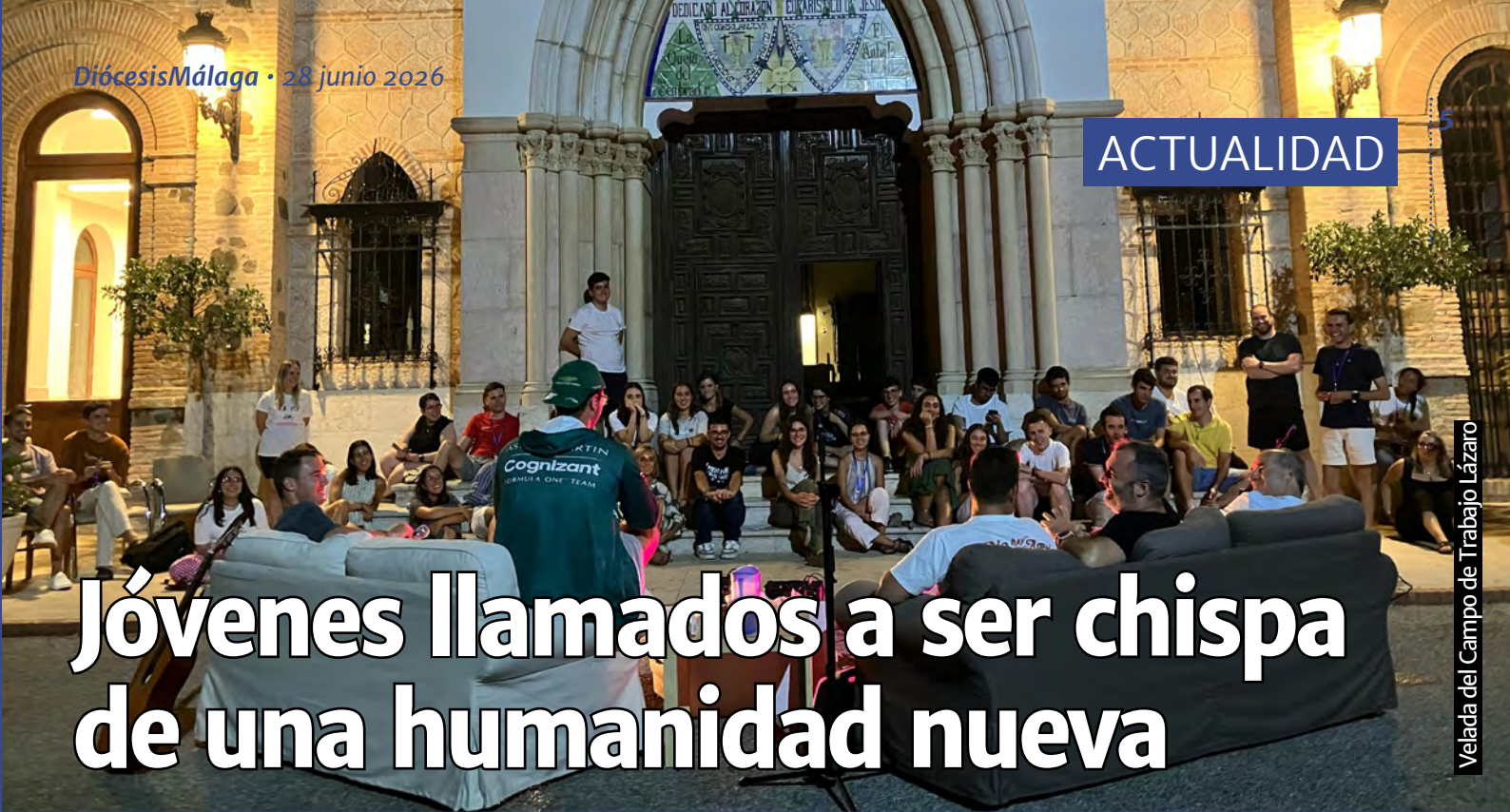
Velada del Campo de Trabajo Lázaro