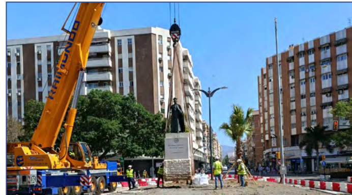
Colocación de la estatua del beato Arnaiz en su emplazamiento original

Este mes de julio, además del encuentro de devotos del Corazón de Jesús el 3 de julio a las 17.30 horas, la iglesia del Sagrado Corazón acoge, el 18 de julio –en que se cumple el centenario de la muerte del P. Arnaiz–, la Misa solemne presidida por el provincial de los jesuitas en España, Enric Puiggrós S.J., a las 19.30 h. En la víspera, está previsto que se descubra la placa que conmemoraba la colocación de la escultura en homenaje al beato, que ya ha regresado a su lugar original frente a El Corte Inglés, después de dos años trasladada por las obras de la prolongación del metro. Hasta el 31 de julio, puede visitarse la exposición “Vida y virtudes del P. Arnaiz sj” en la Comunidad del Sagrado Corazón de Jesús de los jesuitas de Málaga, en la plaza de San Ignacio.