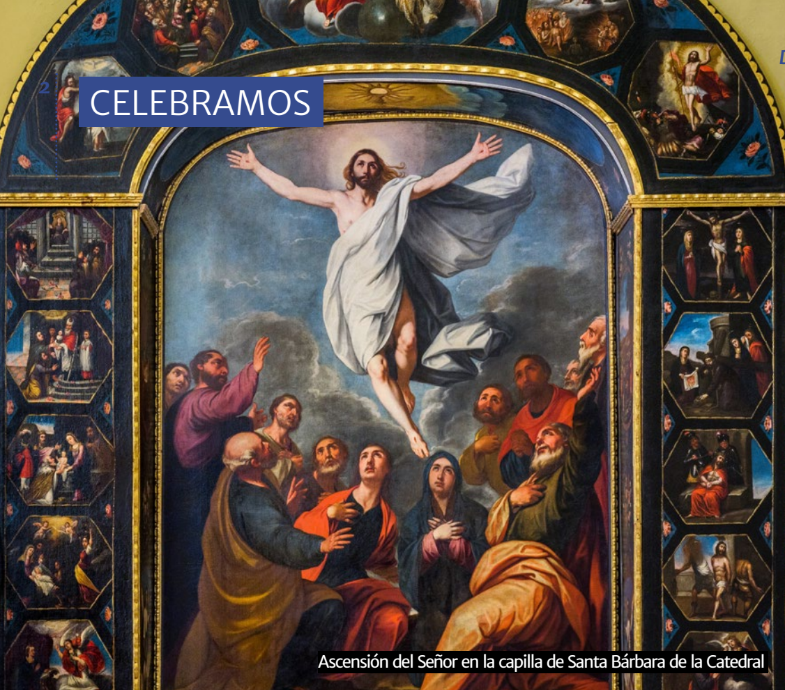
Ascensión del Señor en la capilla de Santa Bárbara de la Catedral