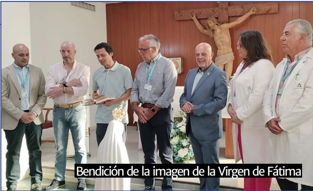
Bendición de la imagen de la Virgen de Fátima